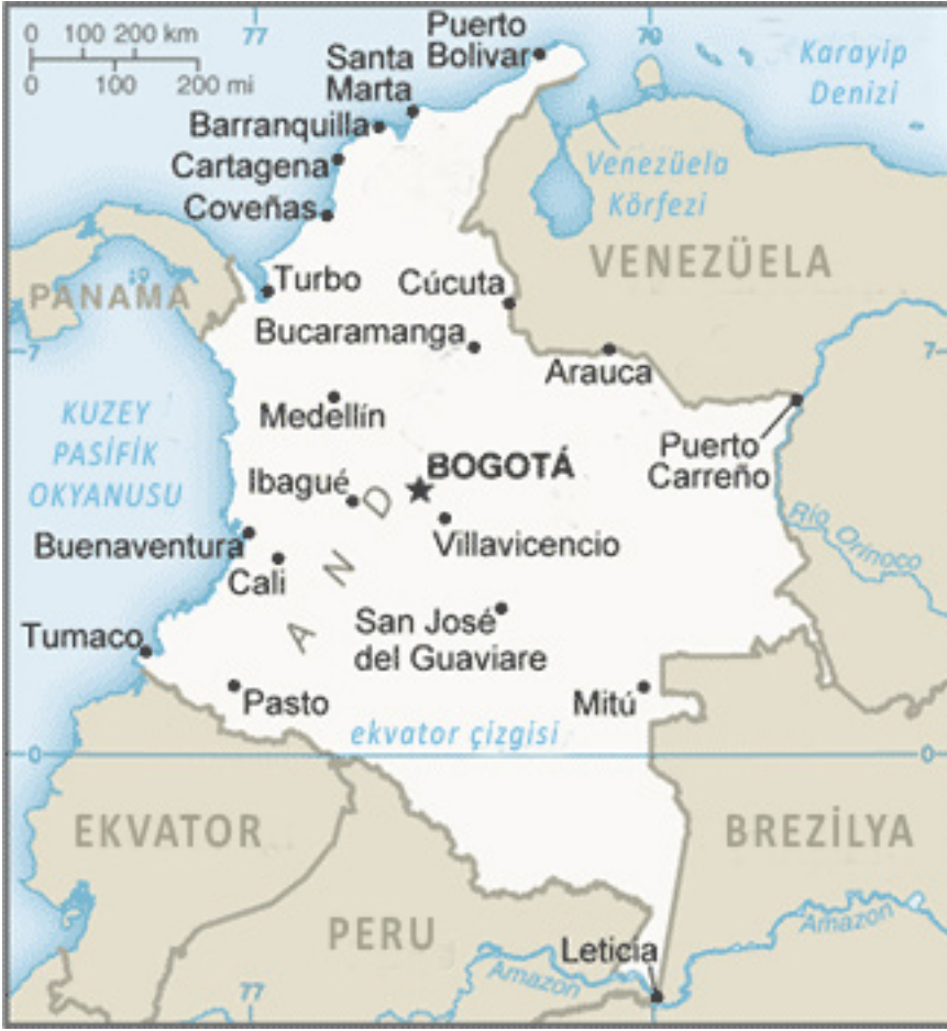
Harita 1. Kolombiya Fiziki Haritası

https://www.cia.gov/library/publications/the-world-fact-book/geos/co.html